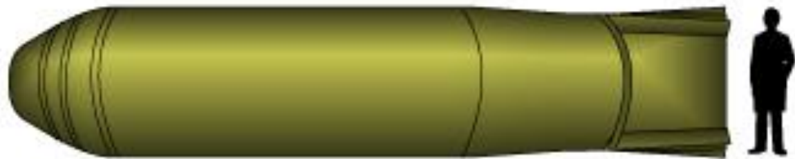
MK-17 (Bravo), 15Mt (1955)