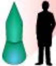
W-59, 1Mt (1962)